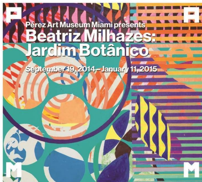
Beatriz Milhazes, Flores e Árvores (detail), 2012-2013. Private Collection.

Please join us to celebrate the opening of Beatriz Milhazes: Jardim Botânico , the first major U.S. retrospective on the Brazilian artist