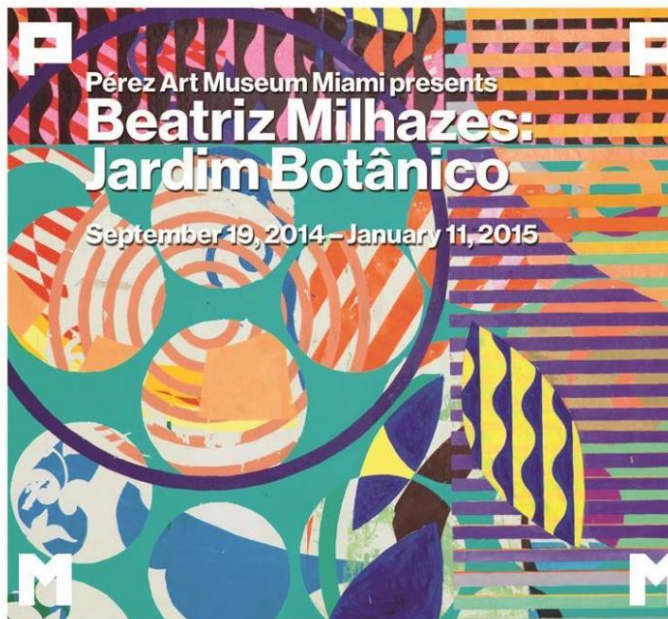
Beatriz Milhazes, Flores e Árvores (detail), 2012-2013. Private Collec

Para informações sobre a exposição, clique aqui .