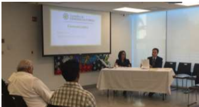
Chefe do Setor de Cooperação Comunitária apresenta o Guia para os membros do Conselho de Cidadãos da Flórida

Com o objetivo de facilitar o atendimento aos brasileiros residentes na Flórida, em especial aqueles que se encontram distantes da sede do Consulado-Geral, foi preparado guia com passo a passo sobre como solicitar serviços pelo correio dos EUA (USPS). Na última quinta-feira, 28 de abril, os membros do Conselho de Cidadãos da Flórida participaram do lançamento do Guia, feito pelo Chefe do Setor de Cooperação Comunitária, na sede do Posto.