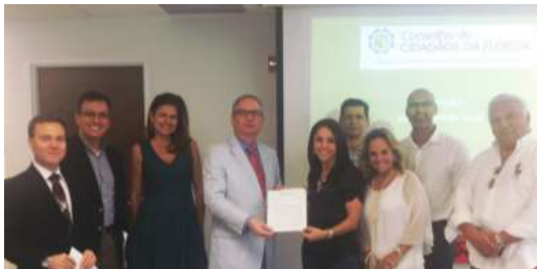
Cônsul-Geral recebe carta dos conselheiros com demandas para a V CBM

Durante a reunião, o Conselho debateu a participação na V edição da Conferência Brasileiros no Mundo (CBM), que será realizada na Praia do Forte, na Bahia. Os principais pontos a serem abordados incluem: a realização das provas do