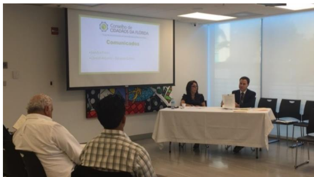
Chefe do Setor de Cooperação Comunitária apresenta o Guia

Para acessar o Guia, clique em http://sistemas.mre.gov.br/kitweb/datafiles/Miami/pt-br/file/Guia%20documentos%20pelo%20correio.pdf