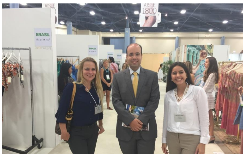
O Chefe do Setor Econômico e de Promoção Comercial do Consulado-Geral e sua equipe na SwimShow 2016, no Centro de Convenções de Miami Beach