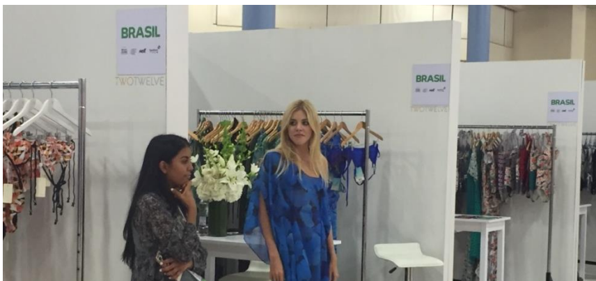
Espaços das grifes brasileiras na feira de moda praia SwimShow 2016

Energia, TM Rio de Janeiro, Trejoa e Triya. Outras seis marcas do Brasil participaram de mostra paralela denominada “Cabana”: Adriana Degreas, Clube Bossa, Isolda, Lenny, Salinas e VIX.