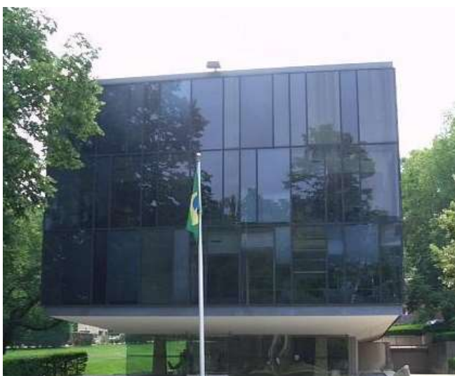
Embaixada do Brasil em Washington

A Embaixada do Brasil em Washington abriu processo para selecionar um novo chef de cozinha. Os almoços e jantares servidos na Embaixada a Chefes de Estados e importantes personalidades têm o objetivo de apresentar a cultura brasileira por meio de nossa culinária. Por esse motivo, essa oportunidade de trabalho está sendo anunciada também na Flórida, região com grande concentração de brasileiros e restaurantes especializados na culinária de nosso país. Trata-se de um reconhecimento da importância da comunidade brasileira local.