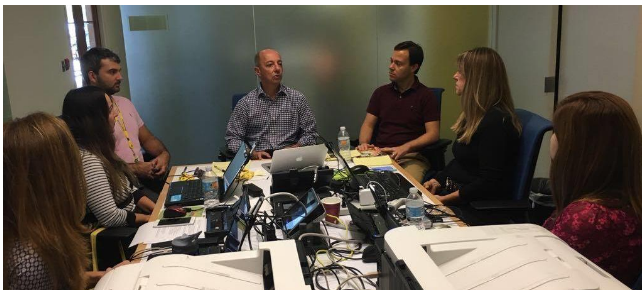
Cônsul-Geral se reúne com a equipe de plantão no escritório temporário montado em Orlando

O escritório temporário do Consulado-Geral funcionou em Orlando no período de 7 a 12 de setembro em razão da passagem do furacão Irma. A equipe retornou para Miami na manhã do dia 13 de setembro com a reabertura do prédio da sede do Posto. O Consulado-Geral retomou o atendimento ao público em 14 de setembro.