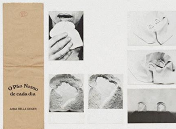
Anna Bella Geiger, O Pão Nosso de Cada Dia, Série de seis (6) cartões postais e saco de pão, 74 x 79 cm, 1978

Ingressos: US$ 30. Terceira idade e estudantes de 12 a 18 anos: US$ 10. Crianças com menos de 12 anos: gratuito.