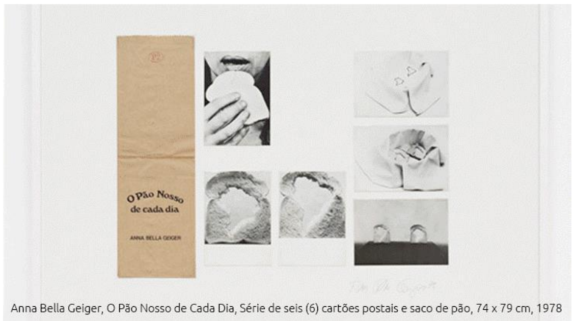
Anna Bella Geiger, O Pão Nosso de Cada Dia, Série de seis (6) cartões postais e saco de pão, 74 x 79 cm, 1978

Ingressos: US$ 30. Terceira idade e estudantes de 12 a 18 anos: US$ 10. Crianças com menos de 12 anos: gratuito. Informações: http://www.pintamiami.com/