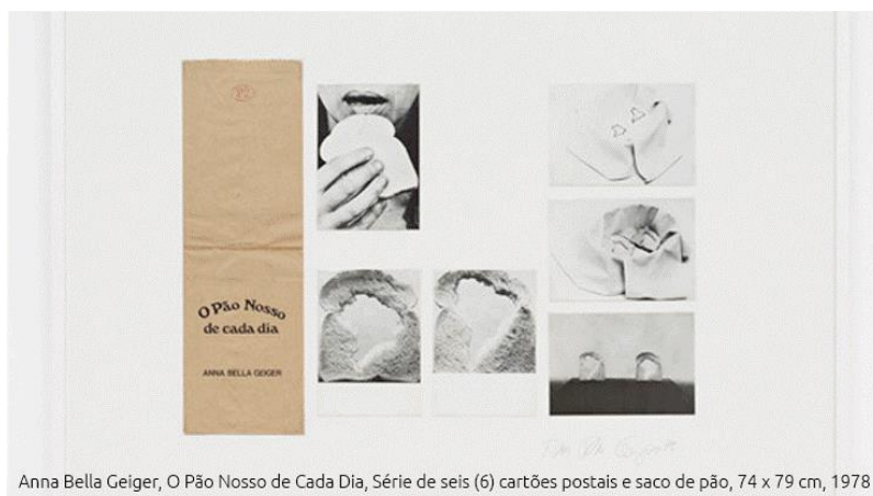
Anna Bella Geiger, O Pão Nosso de Cada Dia, Série de seis (6) cartões postais e saco de pão, 74 x 79 cm, 1978

Horários: Quinta, Sexta e sábado, 12h às 20h. Domingo, 12h às 19h. Ingressos: US$ 30. Terceira idade e estudantes de 12 a 18 anos: US$ 10. Crianças com menos de 12 anos: gratuito. Informações: http://www.pintamiami.com/