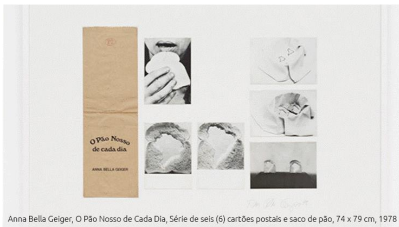
Anna Bella Geiger, O Pão Nosso de Cada Dia, Série de seis (6) cartões postais e saco de pão, 74 x 79 cm, 1978